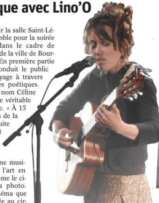
Lino'O sur scène.

Merci pour la sincérité de vos chansons, Merci de porter hauts les valeurs humaines. Que l'amour et l'ouverture combinent de vous guider. JP ya des rencontres... Et parce qu'il n'y a que l'amour : Sophie